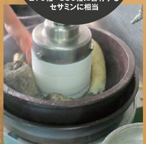
もち玄米と胡麻の搗きこみ工程

セサミン 4mg含有 (製品10g約9枚中) 一般のゴマで 270粒~880粒に含有する セサミンに相当