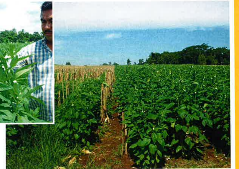
3ヶ月程度、刈り取り間際のリグナン胡麻