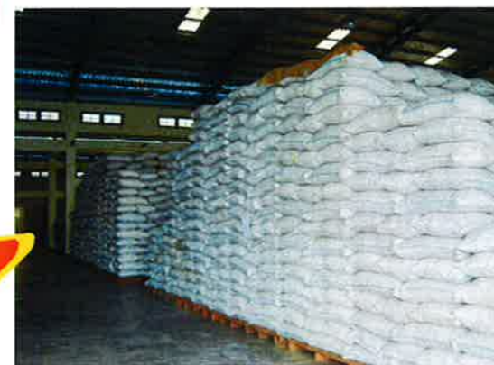
船積み前の倉庫で保管されるリグナン黒胡麻